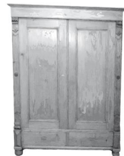
Schrank (zerlegt): 1-türig: 3 Marken 2-türig: 6 Marken 3-türig: 9 Marken