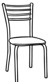
Stuhl: 1 Marke