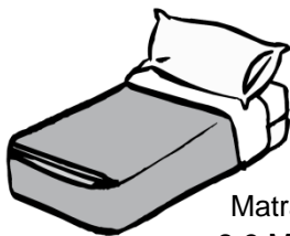
Matratze: 2-3 Marken