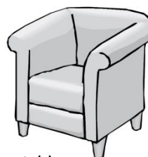
Polsterstuhl: 2-3 Marken