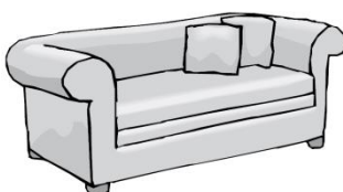
Sofa: 4-6 Marken