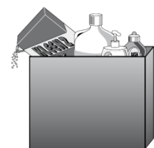
Waschmittelbox voll: 1 Marke