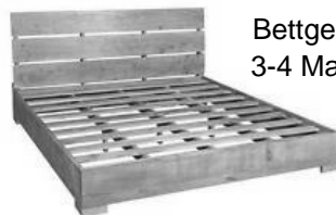
Bettgestell: 3-4 Marken